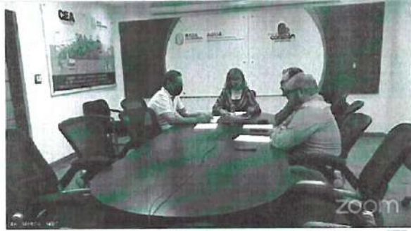
Segunda Sesión Extraordinaria del Comité de Transparencia de la CEAB... Me gusta Comentar Compartir 1 - 50 visualizaciones