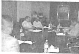
Dip. José Roberto Dávalos Flores (3).jpg 66K