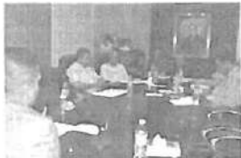
Dip. José Roberto Dávalos Flores (3).jpg 66K