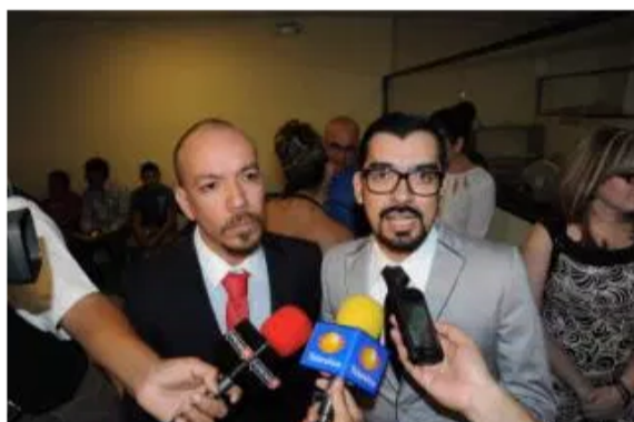
La pareja que intentó casarse en Mexicali.

LA REDACCIÓN 17 DE JUNIO DE 2013 NACIONAL