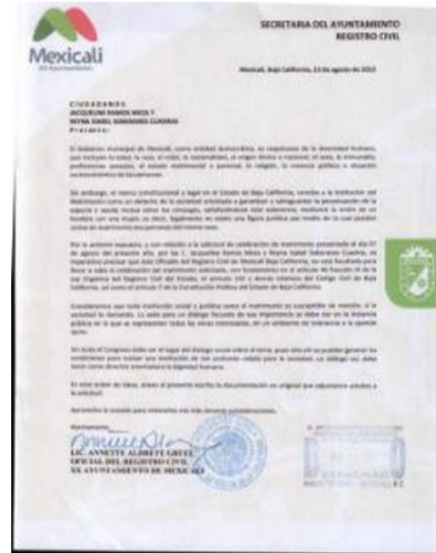
El Ayuntamiento de Mexicali se negó a unir en matrim

La Ley Orgánica del Registro Civil del Estado de Baja California, artículo 46.- Los Oficiales del Registro Civil, o quienes ejerzan sus funciones en su caso, tendrán las facultades y obligaciones siguientes: III.- Exigir el cumplimiento de los requisitos que el Código Civil en vigor señala para los actos y hechos sujetos al Registro Civil. matrimonio "... Derecho de la sociedad orientado a garantizar y salvaguardar la perpetuación de la especie y ayuda mutua entre cónyuges".