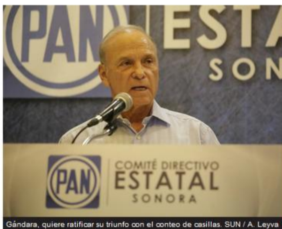
Gándara, quiere ratificar su triunfo con el conteo de casillas.

PAN | Política | Sonora | INE - Instituto Nacional Electoral | Elecciones intermedias México 2015