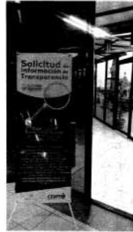
Señalización entrada principal.

SEXTO: Analizadas las manifestaciones expuestas por el Titular del Sujeto Obligado, la coordinación de verificación y seguimiento emitió el dictamen que contiene la valorización del cumplimiento de las obligaciones que pretende cumplir el Sujeto obligado; al siguiente tenor: