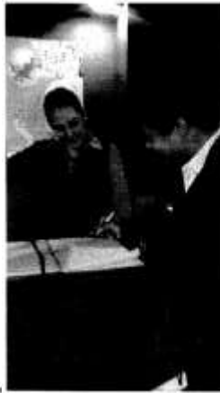
Área de recepción (entrada principal), se cuenta con personal para atención personalizada, incluso que puede tomar notas, recados o en su caso llevar a la unidad de transparencia si así lo requiere el ciudadano.