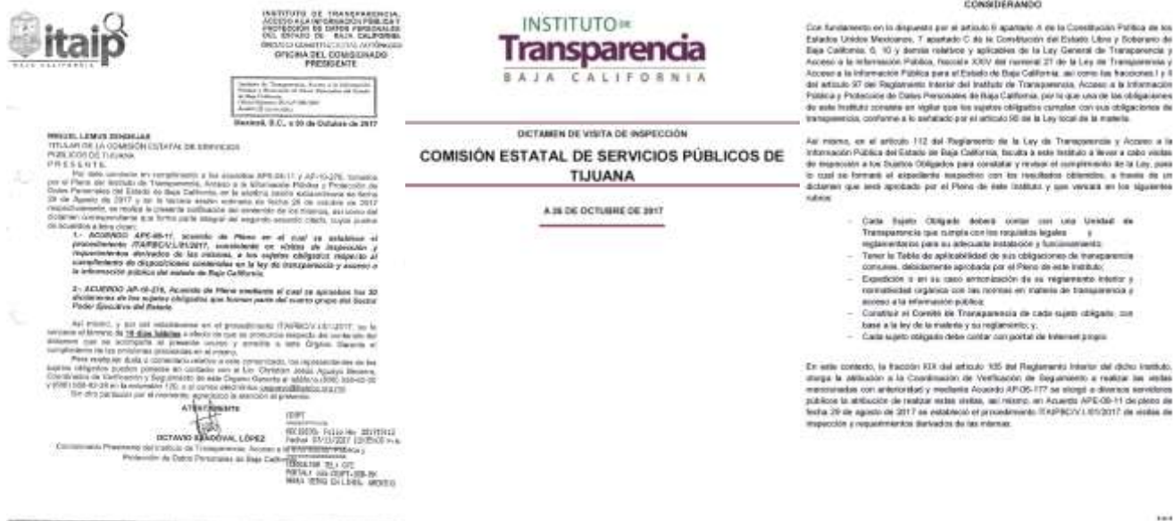
FOTO DEL OFICIO Y DEL DICTAMEN

CUARTO: El 07 de noviembre de 2017, se recibió en las Oficinas de la Comisión Estatal de Servicios Públicos de Tijuana, el oficio número OI/CP/180/2017, de fecha 30 de octubre de 2017, suscrito por el Comisionado Presidente de este Instituto, en cumplimiento a los acuerdos del Pleno de este Instituto APE-08-11 y AP-10-276, y el dictamen correspondiente, concediéndole un término de 10 días hábiles, a efecto de pronunciarse y acreditar el cumplimiento de las omisiones precisadas en el dictamen.