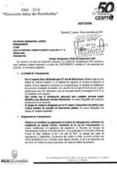
FOTO DEL OFICIO Y ANEXOS