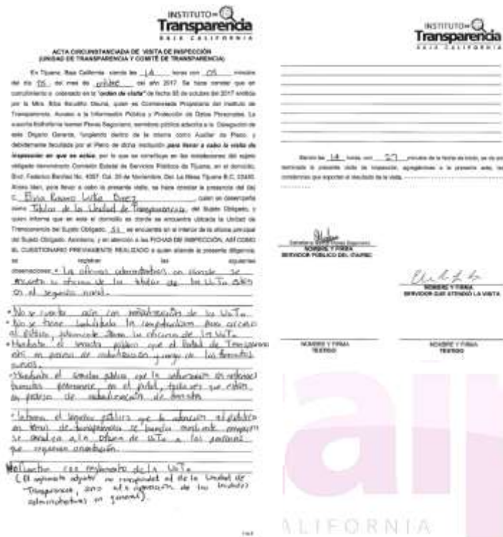
FOTO DEL ACTA

CUARTO: El 07 de noviembre de 2017, se recibió en las Oficinas de la Comisión Estatal de Servicios Públicos de Tijuana, el oficio número OI/CP/180/2017, de fecha 30 de octubre de 2017, suscrito por el Comisionado Presidente de este Instituto, en cumplimiento a los acuerdos del Pleno de este Instituto APE-08-11 y AP-10-276, y el dictamen correspondiente, concediéndole un término de 10 días hábiles, a efecto de pronunciarse y acreditar el cumplimiento de las omisiones precisadas en el dictamen.