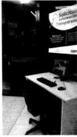
Computadora de consulta para el ciudadano, esta ubicada en la entrada principal del edificio en el de cajeros, se presta a él, debido a que ese espacio se cierra al público a las 11 pm, todos los días.