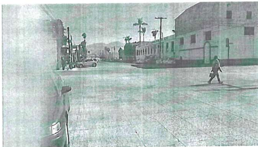
FOTOGRAFÍA NO. 4. SITIO DE TAXIS VERDE Y BLANCO EN AVENIDA MIRAMAR